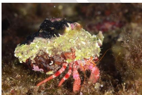
Einsiedlerkreb