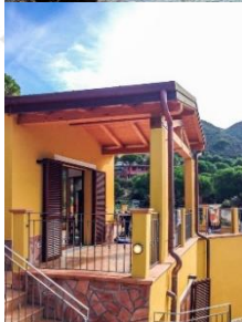
Bilder: Bucht von Morcone – Tauchbasis Aquanautic Elba - Ferienwohnung

Die Ferienwohnungen in der Bucht von Morcone liegen in unmittelbarer Nähe zum Strand und sind nur wenige Meter von der Tauchbasis entfernt. Der lange Strand besteht aus größerem Sand und Kieselsteinen und das Wasser wird gemächlich tiefer.